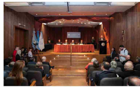
El evento se llevará a cabo entre el 9 y el 10 de octubre.

Académicos, especialistas y representantes de empresas como Google, Amazon, Microsoft y Mercado Libre, participarán del tradicional evento organizado por la Facultad de Ciencias Económicas de la UBA.