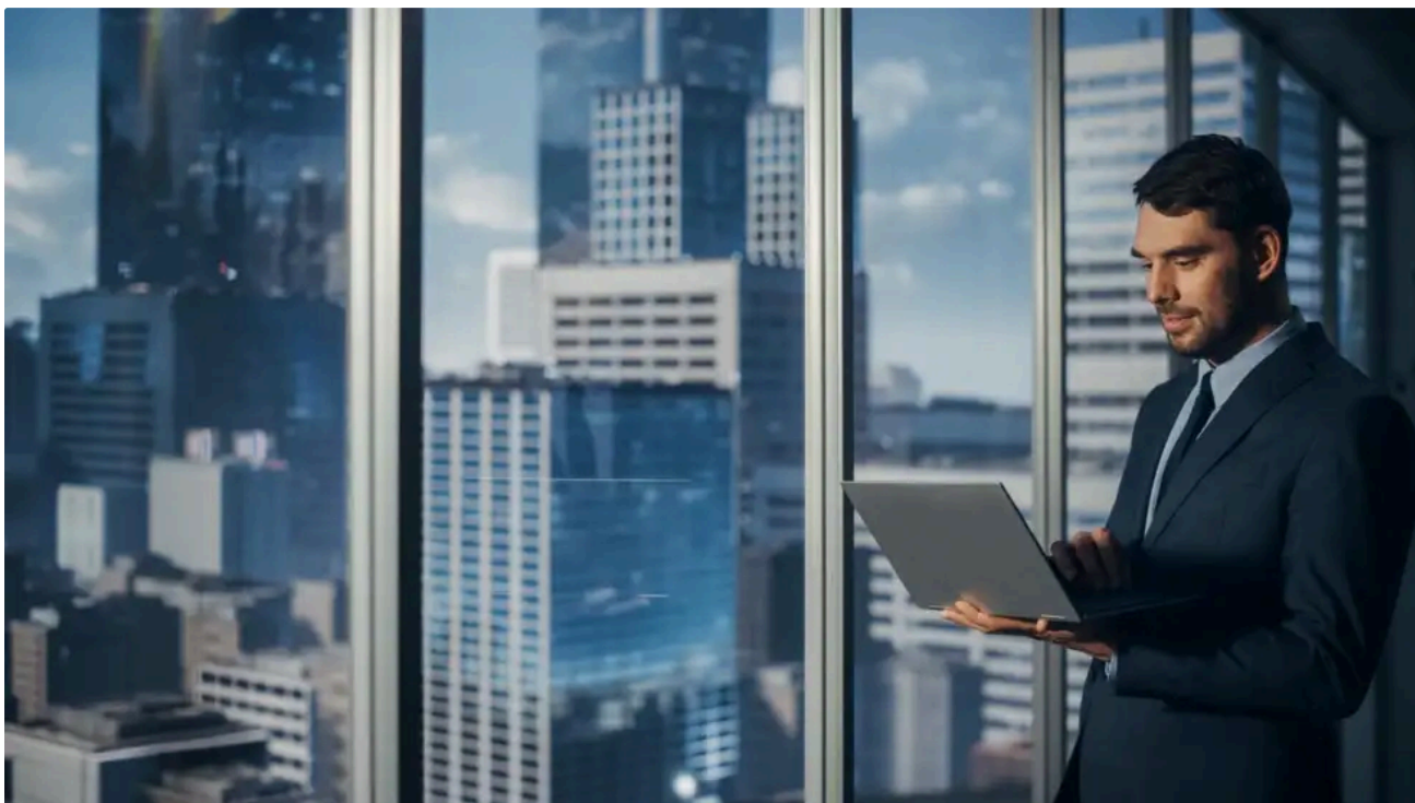
Empresarios, CEOs o ejecutivos

El 65% del empresariado de compañías medianas tiene una buena expectativa para los próximos 12 meses, de acuerdo con el International Business Report (IBR) de Grant Thornton,